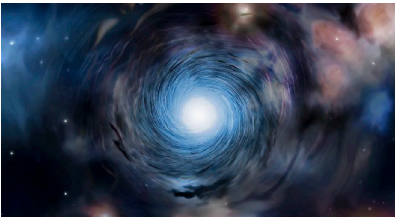
Recreación de una galaxia rotante en el universo temprano.